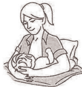
Bajo el brazo de mamá.

Dar la teta con frecuencia, e incluso cambiar de posición, te ayudará a aflojar las mamas y a evitar una mala prendida debido a la turgencia.