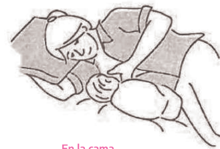
En la cama

Apoyado sobre una almohada, el bebé puede mamar boca arriba.